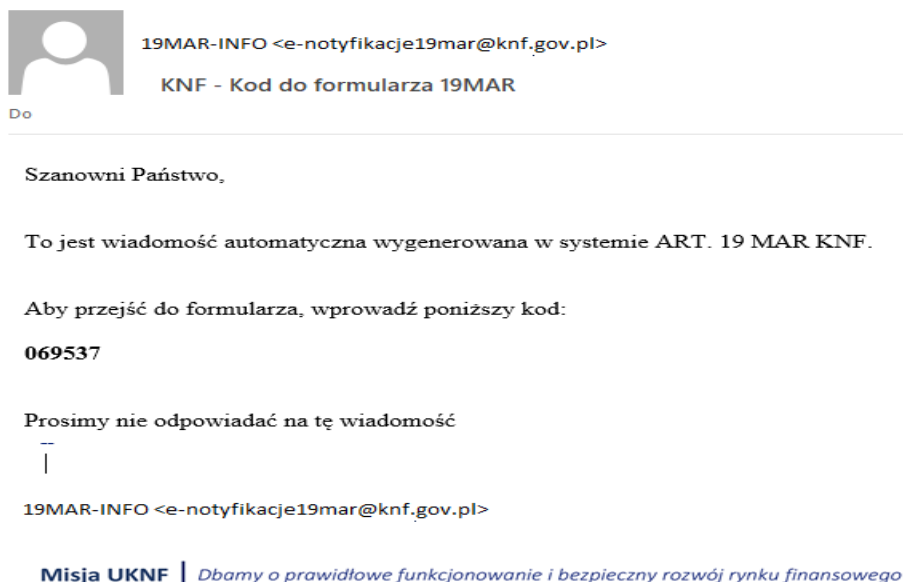
Rysunek 2. Wiadomość e-mail z kodem do formularza

Następnie w kolejnym kroku należy wpisać kod, którego potwierdzenie przekierowuje do strony z formularzem.