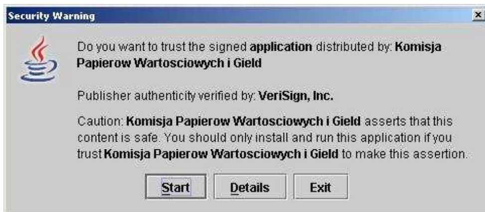
Okno ostrzeżenia związane z certyfikatem użytym do podpisywania plików

W trakcie otwierania aplikacji do wypełniania formularzy może pojawić się okno integracji pobranej aplikacji z pulpitem użytkownika. Nie zaleca się integrowania z pulpitem gdyż może to prowadzić do sytuacji, w której użytkownik będzie otwierał formularz poprzez link na pulpicie a nie ze strony publikacji formularzy ESPI.