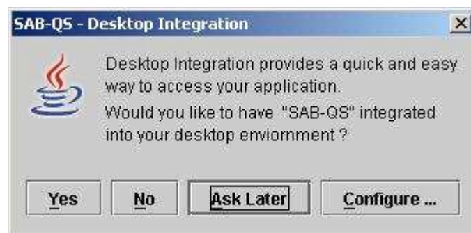
Okno integracji z pulpitem użytkownika

W trakcie otwierania aplikacji do wypełniania formularzy może pojawić się okno integracji pobranej aplikacji z pulpitem użytkownika. Nie zaleca się integrowania z pulpitem gdyż może to prowadzić do sytuacji, w której użytkownik będzie otwierał formularz poprzez link na pulpicie a nie ze strony publikacji formularzy ESPI.