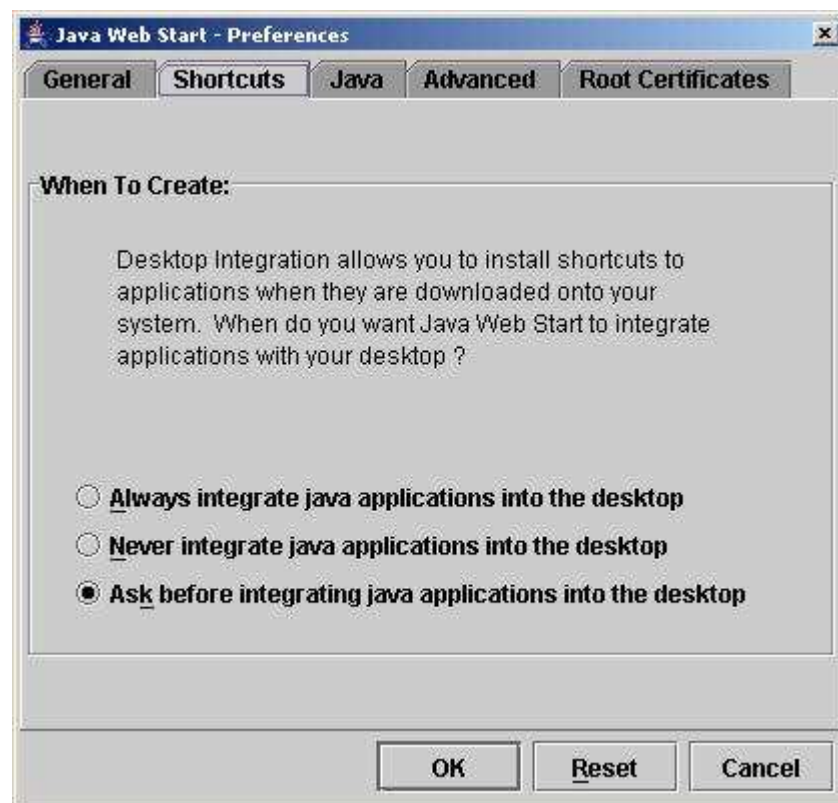
Okno ustawień Java Web Start

Po otwarciu okna ustawień przechodzimy na zakładkę "Shortcuts" i wybieramy opcję "Never integrate java applications into the desktop". Wybór ustawień zatwierdzamy przyciskiem OK.